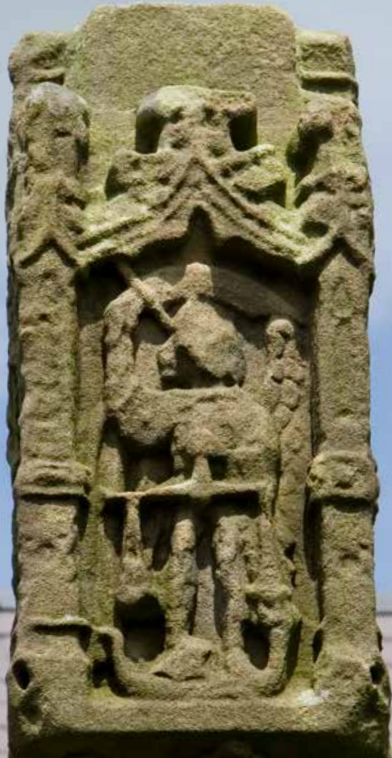
Sant Mihangel yr Archangel, o groes y fynwent

Ceir yn y fynwent, sydd bron yn grwn (nid yw'n eiddo i'r Friends) groes, yn dyddio o'r 15fed ganrif. Yn y cilfachau tua'r brig cedwir ffigurau cerfiedig o Goron'r Forwyn (dwyrain); y Croeshoeliad (gorllewin); y Forwyn a'r Plentyn (gogledd); yr archangel Sant Mihangel, yn pwysio eneidiau ar Ddydd y Farn (de). Ar y border deheuol ceir porth y fynwent gynt, ei borth bwaog wedi ei lenwi pan ddaeth yr adeilad yn ysgol y pentref.